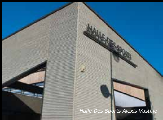
Halle Des Sports Alexis Vastine