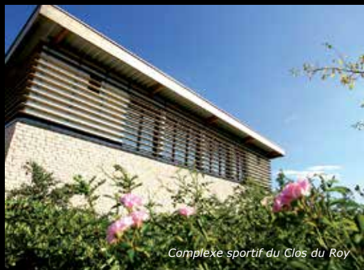
Complexe sportif du Clos du Roy