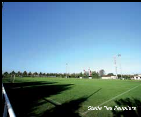
Stade "les Peupliers"