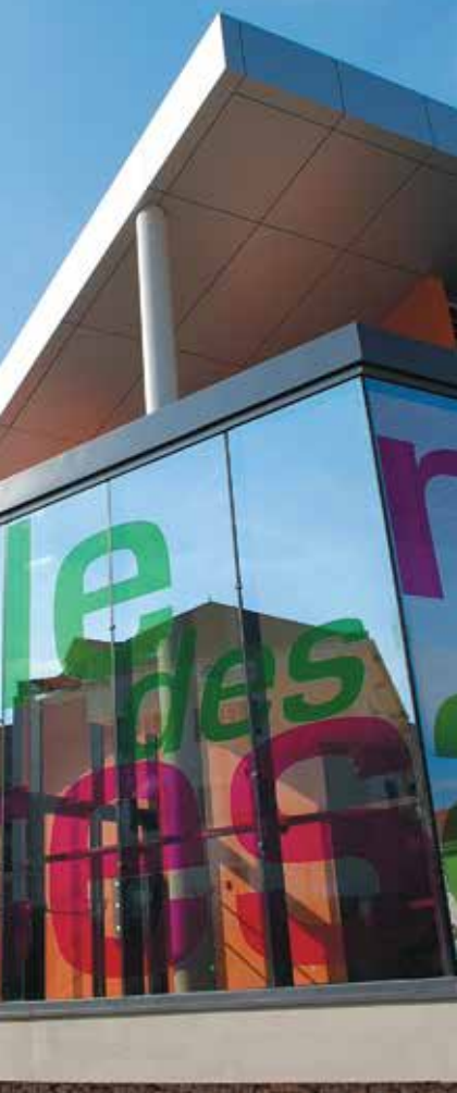
Salle des Fêtes (ou Maison des Associations)