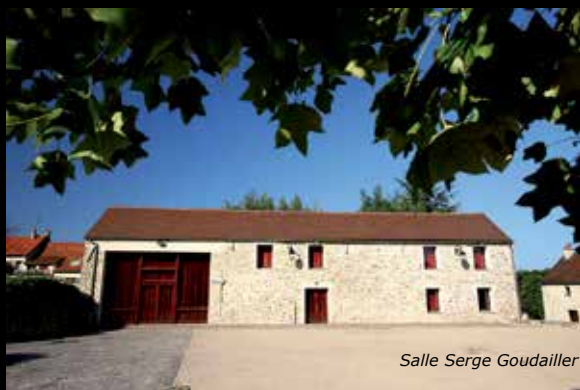
Salle Serge Goudailler