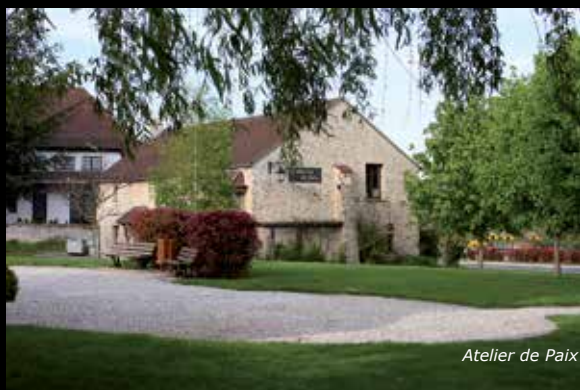
Atelier de Paix