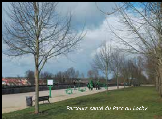
Parcours santé du Parc du Lochy