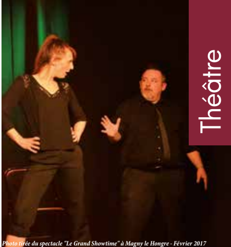
Photo tirée du spectacle "Le Grand Showtime" à Magny le Hongre - Février 2017

Match d'Impro - Durée : 90 minutes (entractes avec bar) - Tarif A - Tout public Avec les comédiens de Casino Impro , Théâtral Suspect , Bio , le Grand Showtime , les Zoscars