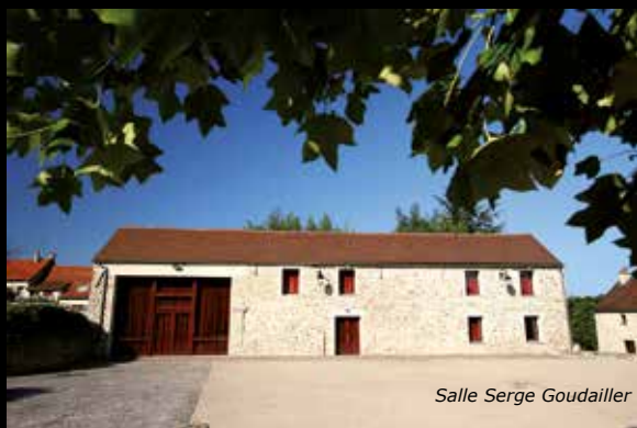
Salle Serge Goudailler