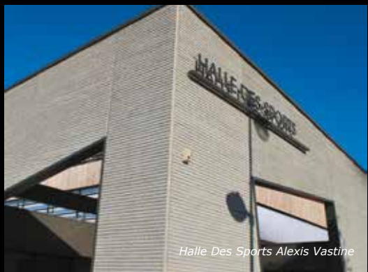
Halle Des Sports Alexis Vastine