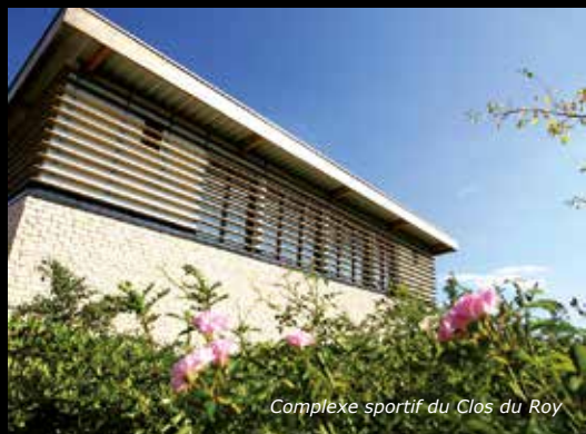
Complexe sportif du Clos du Roy