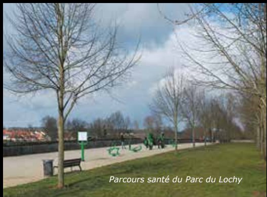
Parcours santé du Parc du Lochy