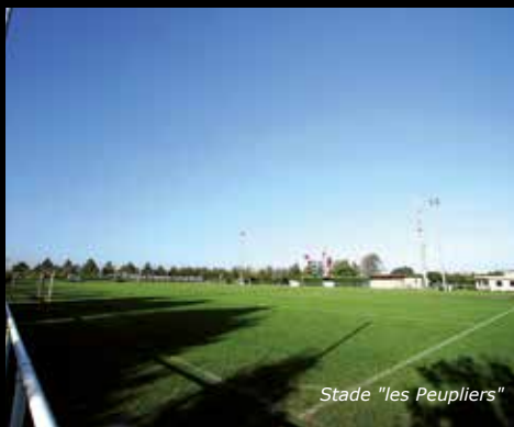
Stade "les Peupliers"