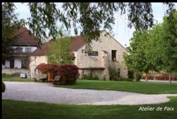
Atelier de Paix