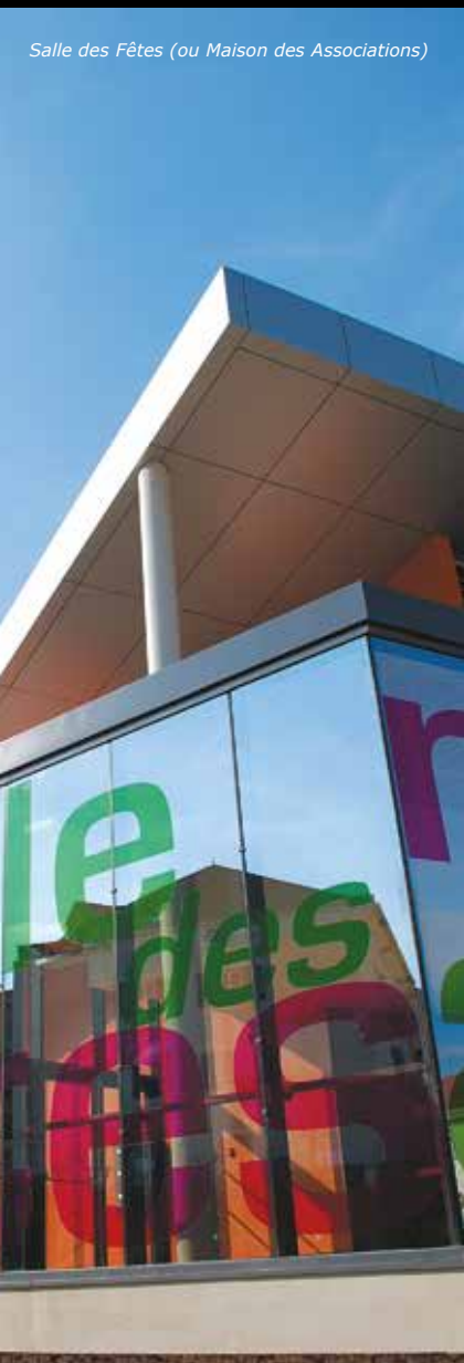
Salle des Fêtes (ou Maison des Associations)