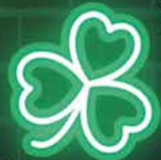
Graphisme : Mairie de Magny le Hongre - Impression : Imprimerie Klein (4 Rue de la Prairie, Bailly-Romainvilliers)

25€ plein tarif - 20€ tarif réduit - 12€ tarif enfant